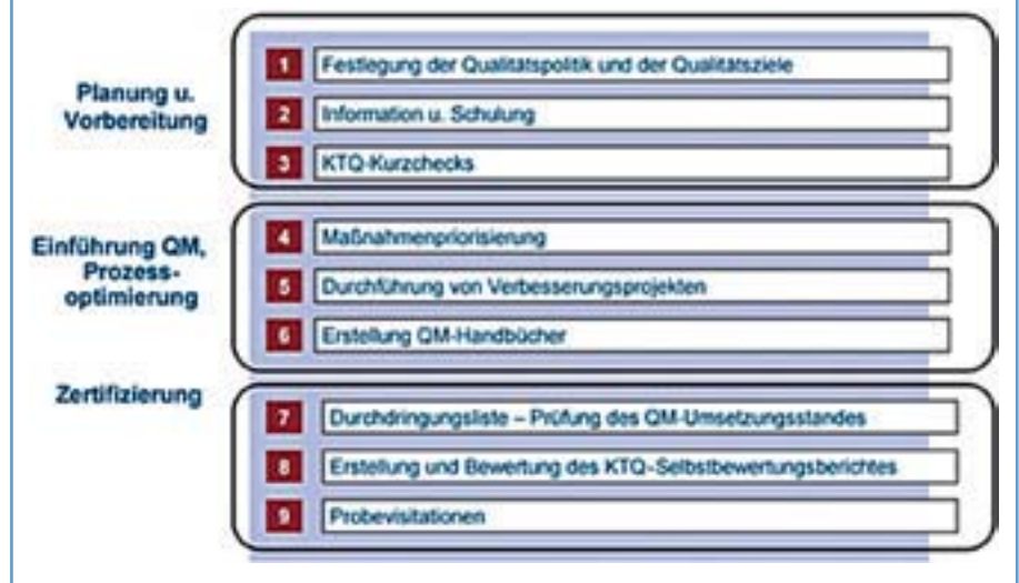
Abbildung 1: Projektplan des UKM zur Einführung eines QM-Systems und zur Zertifizierung nach KTQ®

angemessenen Durchdringungsgrades der QM-Philosophie in der Mitarbeiterschaft einzusetzen.