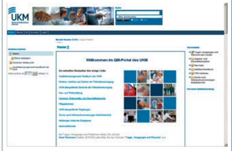
Abbildung 2: Zentrale Qualitäts- und Wissensmanagementplattform des UKM (Startseite)

QM sowie zu weiteren Themenbereichen wie zum Risiko-, Projekt- und Beschwerdemanagement, zu Befragungen und zu einem Ideenwettbewerb abrufbar.